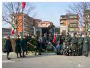
Gruppo storico "Alpini del DOI"