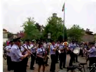
Corpo Bandistico di Maleo