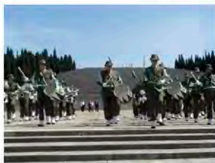
Fanfara Alpina di Asso

Le Cerimonie di sabato saranno accompagnate da: